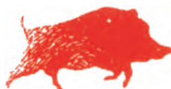
Roccia Rubano Rugby ASD Serie C U18 U16